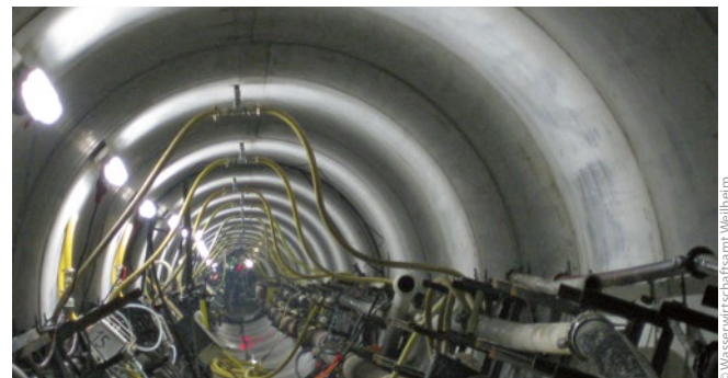
Bild 7: Stollenvortrieb, Laser, Transport- und Versorgungsleitungen, die Bentonit-Injektion zur Reduzierung der Mantelreibung erfolgt über die gelbe Injektionsleitung an Firste und Ulmen

Die Reduzierung der Mantelreibung beim Vortrieb des knapp 175 m langen Stollens erfolgte durch das Einpressen von Bentonit in den schmalen Ringspalt zwischen dem geringen Überschneidung des Bohrkopfs und dem Tunnelrohr ( Bild 7 ). Dazu waren