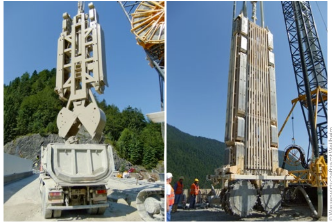
Bild 5: Schlitzwandgreifer und Schlitzwandfräse der Fa. Bauer Spezialtiefbau im Einsatz

Wegen der knappen Bauzeit kamen für die ca. 10 000 m 2 große Dichtwandfläche gleichzeitig ein Schlitzwandgreifer und eine Schlitzwandfräse zum Einsatz (Bild 4). Der notwendige Platzbedarf für den Arbeitsraum und den Begegnungsverkehr der Großgeräte konnte durch eine Verbreiterung der Damm-