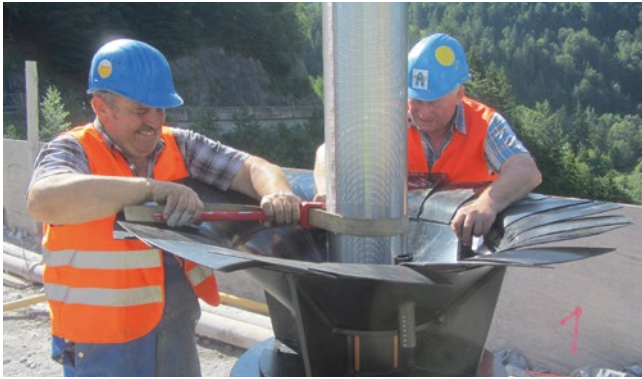
Bild 8: Vorbereitung zum Einbau des Filters (Schlitzbrückenfilter und Sumpfrohr)

separate Injektionspunkte in jedem dritten Rohrabschnitt vorgesehen. Zur weiteren Verringerung der Pressenkräfte waren vorsorglich zwei Dehnereinheiten in der Rohrleitung eingebaut, die aber nicht zum Einsatz kamen. Als Vortriebsleistung konnten im 24-h-Schichtbetrieb als Spitzenleistung acht Rohrabschnitte eingebaut werden, d. h. 22 m pro Tag. Rund 40 % des Zeitaufwands waren für den reinen Vortrieb, 60 % für das Öffnen und Schließen der Vorschubeinheit sowie das Einsetzen eines neuen Rohrabschnitts erforderlich. Die Zielkaverne wurde nach 16 Tagen Rohrvortrieb erreicht. Die Abweichungen des Stollens von der Sollachse betragen in der Höhenlage weniger als 2 cm, in der Seitenlage bis zu 4 cm und sind als äußerst gering zu bewerten. Am Ende der Vorpressstrecke mussten vorab ein 43 m tiefer senkrechter Zielschacht (Durchmesser 6,50 m) und ein rund 20 m langer horizontaler Zielstollen ausgesprengt werden, über den die TBM in zwei Teile zerlegt wieder herausgebracht wurde. Der Zielschacht dient nun ausgestattet mit einem Treppenturm als betrieblicher Notausstieg.