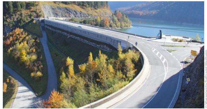
Bild 10: Die neue B 307 mit der verbreiterten Dammkrone im Herbst des Jahres 2015