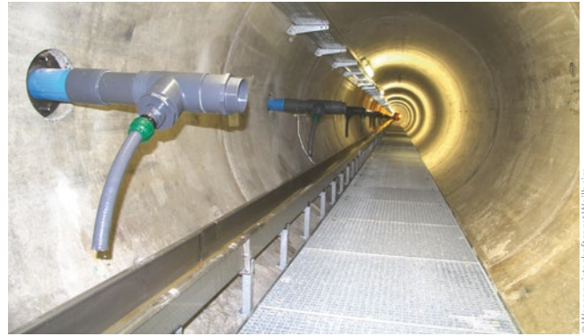
Bild 9: Blick in den Kontrollgang mit Sickerwassersammlersystem und Innenausbau

Zur Erfassung möglicher Sickerwassermengen wurden ab Mai 2014 zwischen Schlitzwand und Kontrollgang sogenannte Drainagepfähle mit einer Tiefe von ca. 41 m hergestellt [8]. Die 54 Großbohrpfähle DN 900 wurden als verrohrte Pfähle in einem Achsabstand (zueinander) von 2,80 m mit einem Schneckenbohrgerät erstellt. 2 150 m der gesamten Bohrstrecke führten durch den Dammkern bzw. den alten Filter, 92 m Bohrpfahllänge haben den in den Flanken anstehenden Fels durchörtert. Auch hier lagen die lotrechten Abweichungen weit unterhalb der zulässigen Toleranzen. In diesen Pfählen sorgt ein geschlitztes Rohr – ähnlich dem bei Brunnen einer Wassergewinnung – für das Sammeln von Drainagewasser, das am Fußpunkt in einem HDPE-Topf gesammelt und in den neuen Kontrollgang eingeleitet wird. In Summe wurden rund 1 700 m Filterrohr, 110 m Filterrohr mit Edelstahlbrautwickelfilter ( Bild 8 ) und 400 m Voll-