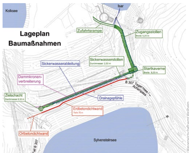
Bild 1: Sylvensteinspeicher: Lageplan zu den Ertüchtigungsmaßnahmen am Sylvensteinspeicher (Dichtwand, Sickerwasserstollen/Kontrollgang, Drainagepfähle)

In einer Bohrkampagne wurden im Jahr 2009 der Staudamm, der alluviale Untergrund und der angrenzende Fels erkundet. Zunächst wurden sieben Bohrungen bis in 140 m Tiefe im Bereich der vorhandenen Kerndichtung abgeteufelt. Die anstehen-