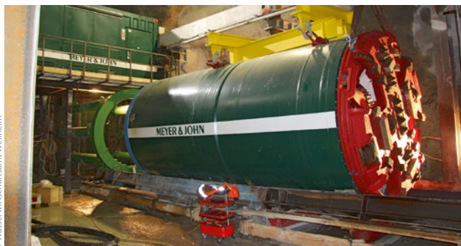
Bild 6: Montage der TBM auf der Schildwiege, dahinter Presseneinrichtung mit sechs Hydraulikzylindern für 2 500 t Schubkraft, darüber Steuerstand für den Vortrieb

Zum Bau des Kontrollganges musste am Fuß der Sylvensteinwand ein ca. 90 m langer Zufahrtsstollen (Höhe 5 m, Breite 4 m)