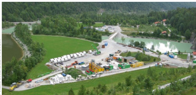
Bild 3: Neue Brücke über den Kolksee, Baustelleneinrichtung und Rohrlager am Fuß des Sylvensteindamms

Der Sylvensteinspeicher liegt in einem wertvollen Naturraum. Der Staudamm selbst liegt in einem Flora-Fauna-Habitat-Gebiet. Um das äußere Erscheinungsbild des Bauwerks nicht zu verändern, wurde eine Lösung mittels Maßnahmen im Damminnern verfolgt. Für die Verbesserung der Kerndichtung kamen vorwiegend Schlitzwandvarianten mit unterschiedlicher Lage zu Dammachse und -kern in Betracht. Auch eine Doppelschlitzwand mit Querschotts wurde als eine Möglichkeit zur späteren Überwachung angedacht. Lösungsvarianten mit Bohrpfahlwänden schieden wegen der fehlenden Maßgenauigkeiten bei der lotrechten Herstellung in der geforderten Tiefe aus. Injektionsvarianten erfüllen die gewünschte flächenhafte Verbesserung des Kerns nicht, zudem waren dabei weitere Beeinträchtigungen des gegliederten Dammquerschnitts nicht auszuschließen [4].